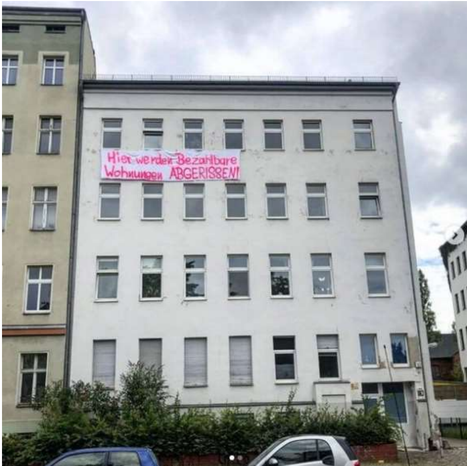
Protest-Transparent an einem der Häuser im Sommer 2021