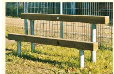
Abb.10: Beispiel ‚Lümmelbank‘