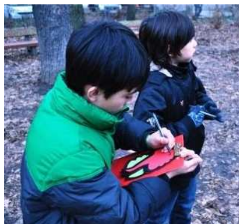
Abb.3: Bestandsaufnahme vor Ort