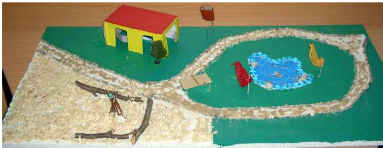
Abb.6: Das große Modell der 'Dünja-Mädchen'