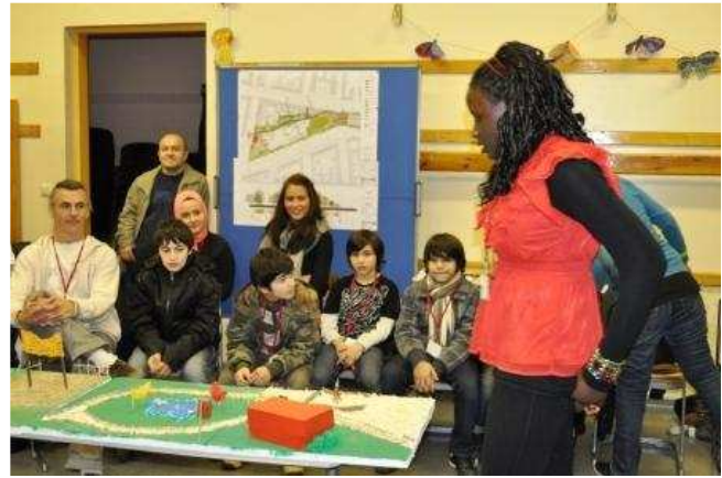
Abb.7: Vorstellung der Arbeitsergebnisse