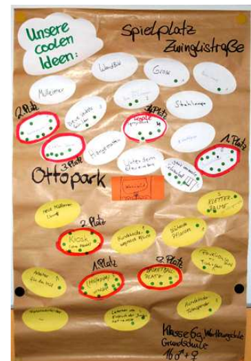
Abb.5: Ergebnisplakat Ideen

Im Anschluss sammelten die Gruppen Ideen für die Umgestaltung. Dabei wurden bereits wichtige Rahmenbedingungen – wie z.B. die Unmöglichkeit eines Fußballfeldes auf der Jugendfläche – genannt, bzw. völlig unrealistische Ideen besprochen und z.T. aus der Vorschlagsliste herausgenommen. Ebenfalls wurde geklärt, dass bei der Menge der Ideen nicht alles umgesetzt werden kann. Mittels einer Bepunktung wählte jede/r Beteiligte die für ihn bzw. sie zwei wichtigsten Ideen zu den beiden Spielorten aus, so dass eine Prioritätenliste entstand. Die drei Ideen mit den meisten Punkten wurden zum Schluss auf dem Plakat gesondert hervorgehoben.