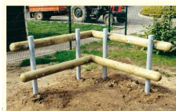
Abb.9: Beispiel ‚Lümmelbank‘ über Eck