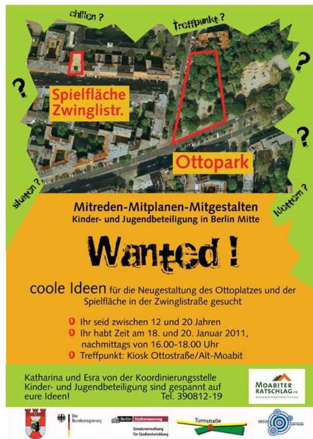
Abb.1: Einladungsflyer zum offenen Jugendworkshop

Neben diesen festen Gruppen wurde zu einem offenen Ideenworkshop eingeladen. Angesprochen wurden hierzu die etwas weiter entfernt liegenden Jugendeinrichtungen K3 – Kids-Kiez-Klub von Frecher Spatz e.V. in der Kirchstraße, der Jugendclub Schlupfwinkel des Evangelischen Klubheim e.V. in der Kaiserin-Augusta-Allee, sowie der direkt an die Fläche im Ottopark angrenzende PbS Ottopark. Zudem wurde in den umliegenden Wohnhäusern mittels eines Flyers eingeladen (Stückzahl 300), der in Briefkästen und Hauseingänge verteilt wurde. An dem offenen Workshop haben sich 7 ältere Kinder des K3, sowie 3 Kinder aus dem ‚Offene-Tür-Bereich‘ des PbS Ottopark beteiligt. Zwei weitere Jugendliche meldeten sich auf den Flyer zurück, dass sie prinzipiell Interesse gehabt hätten, aber an den Terminen keine Zeit. Drei weitere ältere Jugendliche, die sich zur Workshopzeit im Ottopark aufhielten, wollten sich zwar nicht während der ganzen Zeit beteiligen, steuerten aber mehrere Ideen bei.