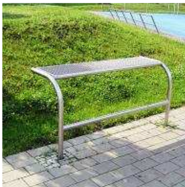
Abb.8: Beispiel ‚Lümmelbank‘, Quelle: Firma Spielplatz Hammer